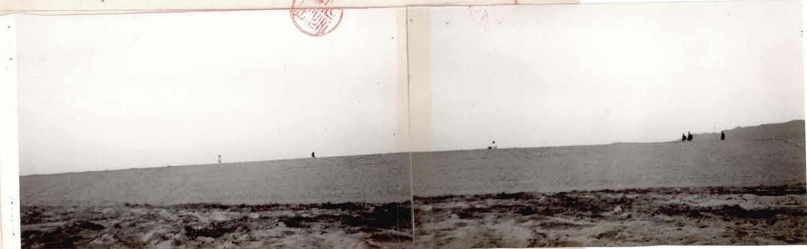
죽제빛 죽제시골 전경