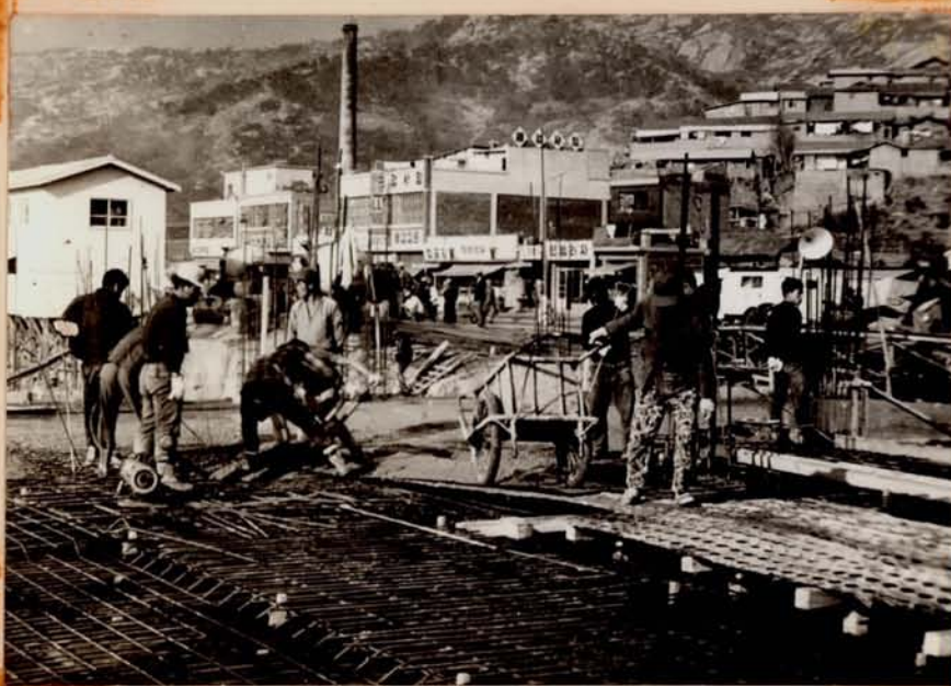
스라브 GONG. 2/71