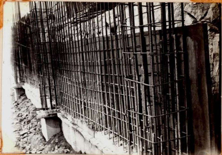
옹벽 CONC. 및 거푸집 철근 조립