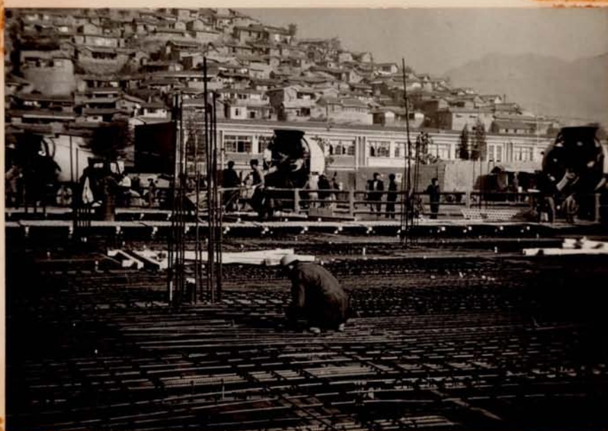
스라브 형틀 조립 및 철근조립