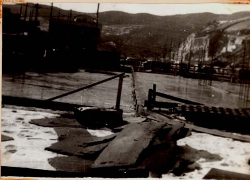
스라브 GONG. 2/71