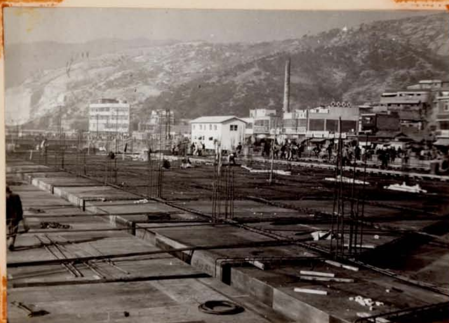
스라브 철근 배근 및 CONC.