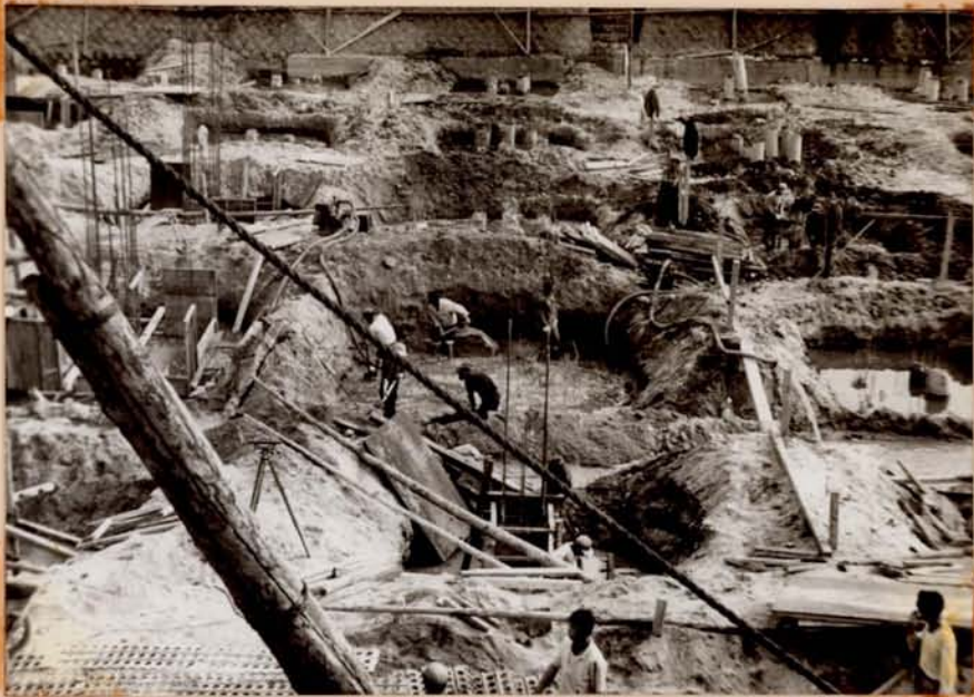
기초 콘크리트 및 거푸집 조립